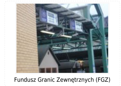
Fundusz Granic Zewnętrznych (FGZ)

Przejdź do Decyzji nr 574/2007/WE umieszczonej na stronie EUR-lex