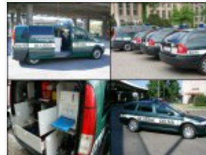
Pojazdy kupione w ramach projektu "Doposażenie grup mobilnych Polskiej Służby Celnej w środki transportu wyposażone w sprzęt kontrolny"