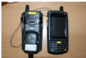
Urządzenia kupione w ramach projektu "Organizacja masowego dostępu mobilnych służb policyjnych do Systemu Informacyjnego Schengen"