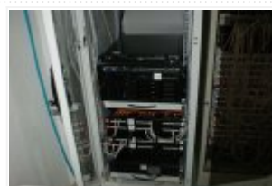
Serwer kupiony w ramach projektu "Wdrożenie przepisów z Schengen poprzez budowę infrastruktury"