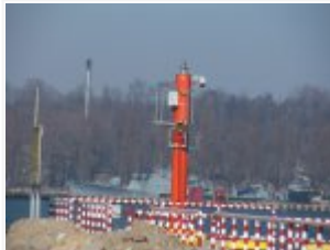
Kamera kupiona w ramach projektu "Wzmocnienie morskiego przejścia granicznego w Porcie Gdynia - System monitoringu bezpieczeństwa portu"