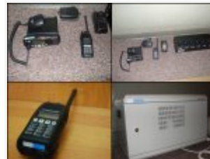
Urządzenia kupione w ramach projektu "Wymiana informacji z zakresu Schengen drogą radiową"