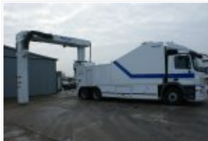
Pojazd kupiony w ramach projektu "Doposażenie grup mobilnych w 4 przewoźne urządzenia rentgenowskie do prześwietlania pojazdów i kontenerów"