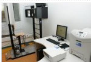
Sprzęt kupiony w ramach projektu "Przygotowanie jednostek Policji do prowadzenia teleinformatycznej"