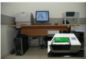
Zakup urządzeń do daktyloskopii na granicy Rzeczypospolitej Polskiej i Unii Europejskiej