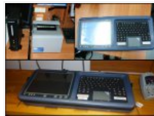
Urządzenia kupione w ramach projektu "Wymiana sprzętu i oprogramowania do kontroli ruchu granicznego i ochrony granicy państwowej"