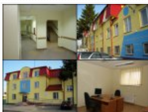
Rozbudowa i przebudowa Komisariatu Policji w Terespolu