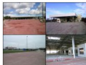
Rozbudowa Drogowego Przejścia Granicznego w Terespolu - platforma północna