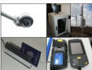
Urządzenia kupione w ramach projektu "Rozbudowa zintegrowanego systemu"