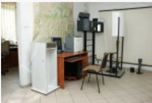
Sprzęt kupiony w ramach projektu "Przygotowanie Policji do prowadzenia teleinformatycznej rejestracji i sprawdzania danych osób"