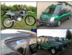
Pojazdy kupione w ramach projektu "Zakup sprzętu transportowego dla Straży Granicznej"